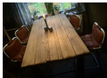
Återvinning - sånt jag gör in emellan