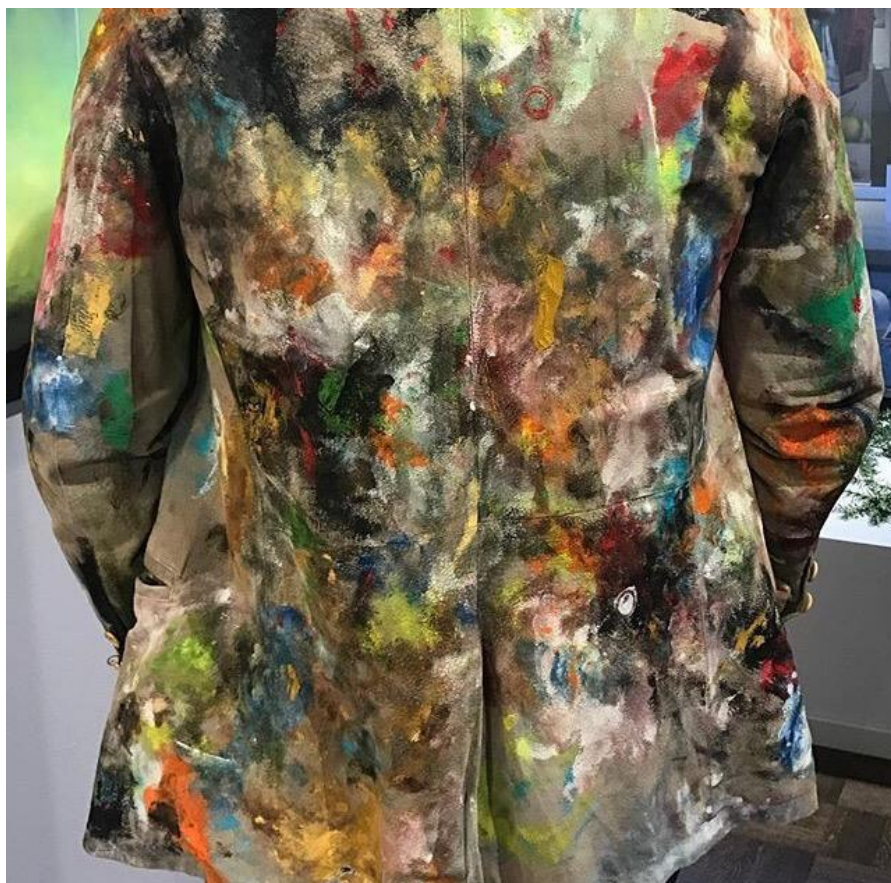
Vernissagekavajen – ett måste vid utställningsöppningar