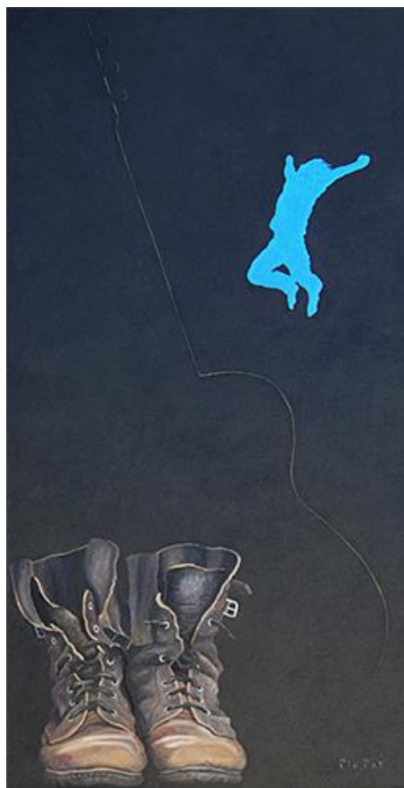
"Blues" 80*50 en s.k. såld olja

Det blir även väldigt mycket trädgårdsdesign och inredningskonst. Eller återvinningsmöbler. Det bubblar för jämnare skulle man kunna säga. Sällan blir en utställning följd av en likadan. När jag överraskar mig själv så trivs jag bäst.