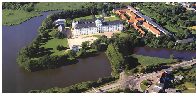
Gottorps Slott hade varit en lagom sommarstuga men jag har tappat kontakten med släkten, typ.