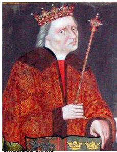
Visst är det svårt att se men kung Christian I hade faktiskt en far som gick under det underbara namnet Didrik den lycklige