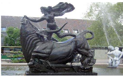
Europa och tjuren, skulptur av Milles i Halmstad. Hur många gånger har jag inte passerat den? Tänk om jag vetat att vi av varlägsna släktingar...