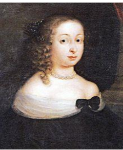
Drottning Hedvig Eleonora